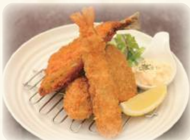
ミックスフライ 900円 海老、牡蠣、鰻、カボチャコロケの盛り合わせ