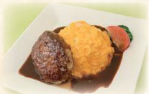
オムライス & ハンバーグ 1000円