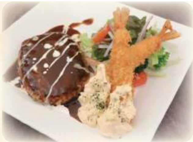
海老フライ & ハンバーグ 洋食の王道をどうぞ 1100円