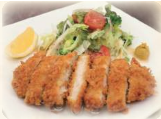
三元豚のロースカツ やわらかさの中にも弾力ある食感 1000円