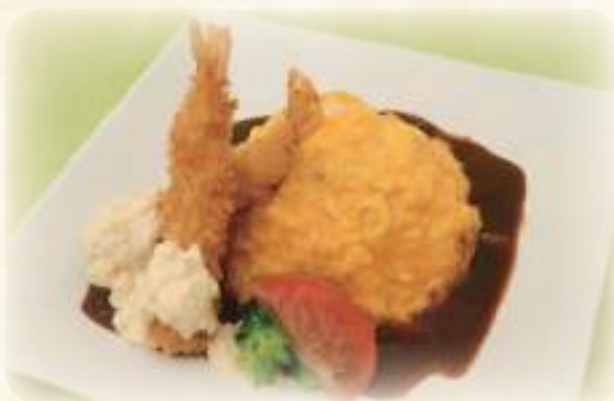
オムライス & 海老フライ 1000円