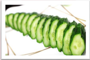
きゅうりの一本漬