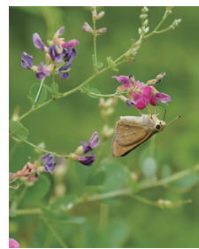
昨年のヤマハギとチヤバネセセリ