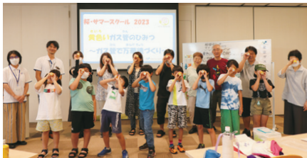
(上) ガス管で万華鏡作りの集合写真 (右左) 親子下水道教室で顕微鏡観察 (右中) 蓄電器付きのLEDライト作り (右下) ぶちエコバッグ作りでアイロンがけ