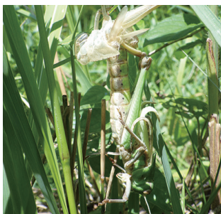
脱皮中のトノサマバッタ

タやハラビロカマキリ、シヨウリヨウバッタなど、様々な生きものが活発に活動し、脱皮や羽化の時期を迎えています。もしこういった瞬間に出会えたら、絶対に触らず、生きものを怖がらせないようにしながら、じっくりと観察してみてください。