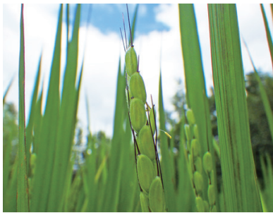
出穂を迎えたイネ