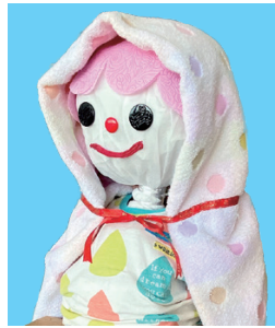
バスタオルの防災頭巾

台風、豪雨、暴風、地震…。災害は、いつでも身近に起こるものになってきています。関東大震災から100年となる今年、毎日の暮らしの中で、様々な災害への備えを考えてみませんか。