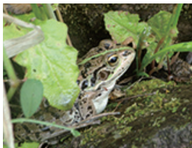
ビオトープのトウキョウダルマガエル

今回のビオトープクラブは、6月27日(日)から「外来植物の対処法」を、7月4日(日)から「マコモで七夕馬を作ろう!」を動画で配信します。