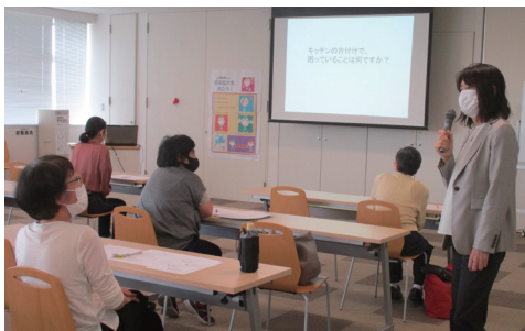
参加者への質問コーナー

5月26日(水)に、「桜・お片づけ講座」キッチン編キッチンからはじめるお片づけ」を開催し、30〜80代と幅広い世代の方にご参加いただきました。 講師の方には、料理がスムーズにできる家事導線を考えた収納、必要なものの優先順位を考えた収納などのほか、「片づける」ことが環境を考えることにもつながる、というお話をさせていただきました。