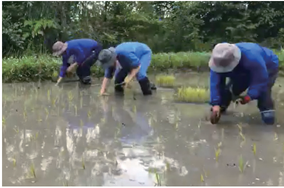
スタッフによるピオトープの田植え作業

桜環境センターでは、毎年、種まきから田植えへ稲刈りや脱穀・粃すりまでの稲作作業と、農の営みとともに生きる様々な動植物の観察を、親子で体験する「田んぼクラブ」を開催しています。 年7回のイベントで、今年