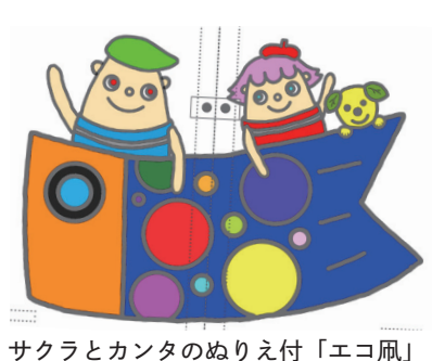
サクラとカンタのぬりえ付「エコ風」

から5月末まで公開しました。 内容は、初級編クイズの「公園に落ちていたらいけないものががし」「さいたまの自然ではないものさ