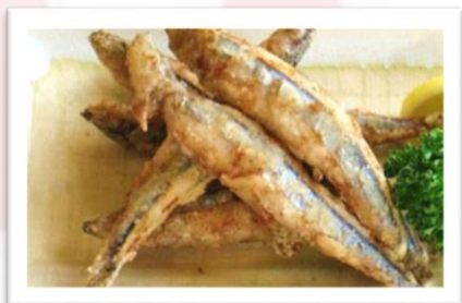
きびなごの唐揚げ